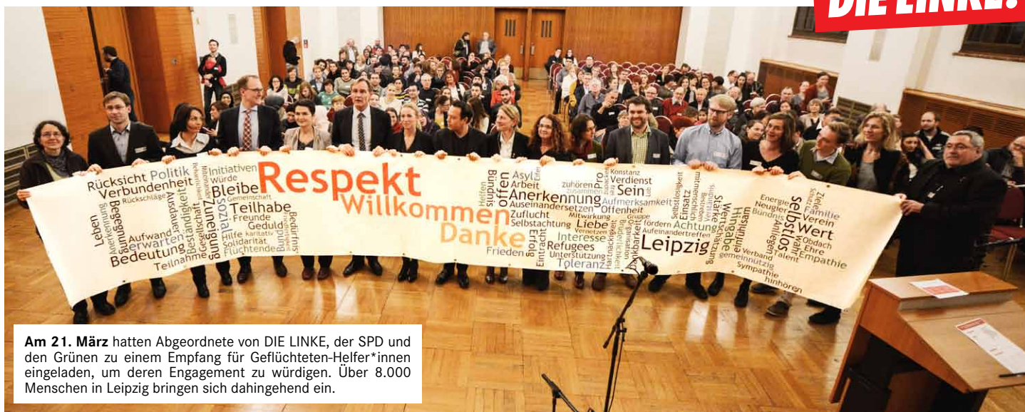
Am 21. März hatten Abgeordnete von DIE LINKE, der SPD und den Grünen zu einem Empfang für Geflüchteten-Helfer*innen eingeladen, um deren Engagement zu würdigen. Über 8.000 Menschen in Leipzig bringen sich dahingehend ein.