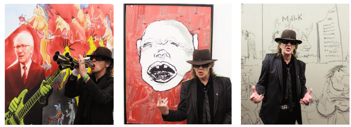
Udo Lindenberg im Museum der bildenden Künste Leipzig: Party, Politik und Positionen