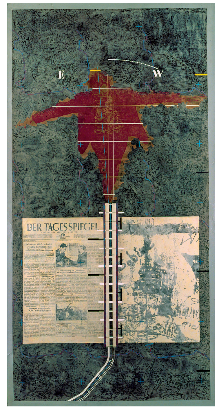
Thom Mayne: "Berlin Wall", 1988, Mischtechnik, 199 × 100 cm, mit Stephanie Adolph & Ahti Lahti

Bestehendes, sie können eigenständig träumen, ganz nah dran an der Konzeptkunst. Der Phantasie Raum geben. Bis in die dritte Dimension. Thom Mayne zeigt es uns. Bravo! "Thom Mayne: Skulpturale Zeichnungen", bis 15. November 2020: Tchoban Foundation, Museum für Architekturzeichnung, Christinenstraße 18a, Berlin, Mo - Fr: 14 -19 Uhr, Sa - So: 13 - 17 Uhr, Eintritt: 5 Euro, ermäßigt: 3 Euro