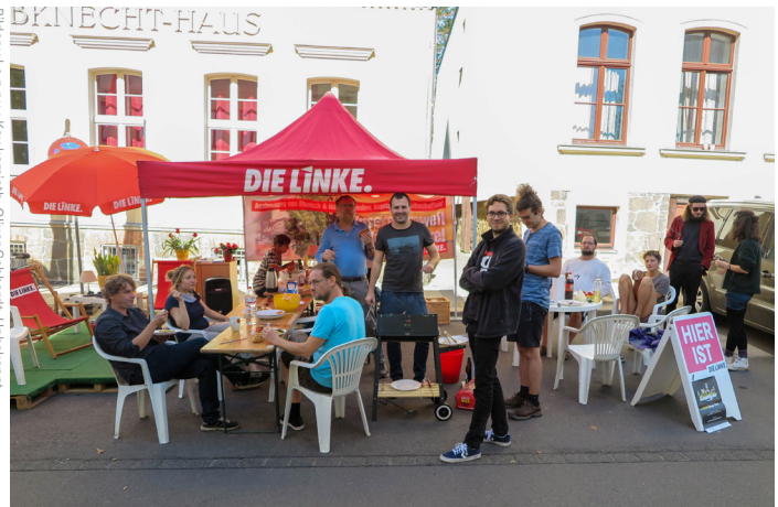
3 Bilder aus Mai und Juni 2020 Bild links oben: Wie immer beteiligten sich auch unsere Büros am "Parking Day", der auf den enormen Platzverbrauch von Parkplätzen hinweisen möchte. Im Bild: Parking-Day am Liebknecht-Haus.

Bild rechts oben: Am 15. September bat die 100. Grundschule in Lausen-Grünau via Facebook ihre Elternschaft um Hilfe. Die Schulleitung benötigte dringend Desinfektionsmittel, Feuchttücher und Seife, um die erforderlichen Hygienemaßnahmen während der Corona-Pandemie für die Schülerinnen und Schüler und das Lehrerkollegium umsetzen zu können. Bereits am Morgen darauf stand Sören Pellmann, selbst Grundschullehrer, vor der Tür der Bildungseinrichtung und überbrachte zwei volle Kisten mit Hygieneartikeln. Nicht zum ersten Mal kommt die Schule in den Genuss schneller, unbürokratischer Hilfe des Leipziger Bundestagsabgeordneten. Als der Pizzaofen der Schule mutwillig zerstört wurde, spendete er einen größeren Betrag, damit bald wieder gebacken werden konnte.