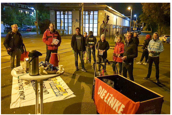
Bild rechts unten: Am Morgen des 29. September standen die Räder im Leipziger Öffentlichen Personennahverkehr (ÖPNV) still. Grund war ein Streikaufruf der Gewerkschaft Verdi, die für die Beschäftigten im öffentlichen Nahverkehr mehr Gehalt, eine 38-Stunden-Woche und eine Sonderzahlung fordert. Unsere Genoss*innen unterstützt die Streikenden und deren Forderungen in diesem Tarifkonflikt.

Bild rechts oben: Am 15. September bat die 100. Grundschule in Lausen-Grünau via Facebook ihre Elternschaft um Hilfe. Die Schulleitung benötigte dringend Desinfektionsmittel, Feuchttücher und Seife, um die erforderlichen Hygienemaßnahmen während der Corona-Pandemie für die Schülerinnen und Schüler und das Lehrerkollegium umsetzen zu können. Bereits am Morgen darauf stand Sören Pellmann, selbst Grundschullehrer, vor der Tür der Bildungseinrichtung und überbrachte zwei volle Kisten mit Hygieneartikeln. Nicht zum ersten Mal kommt die Schule in den Genuss schneller, unbürokratischer Hilfe des Leipziger Bundestagsabgeordneten. Als der Pizzaofen der Schule mutwillig zerstört wurde, spendete er einen größeren Betrag, damit bald wieder gebacken werden konnte.