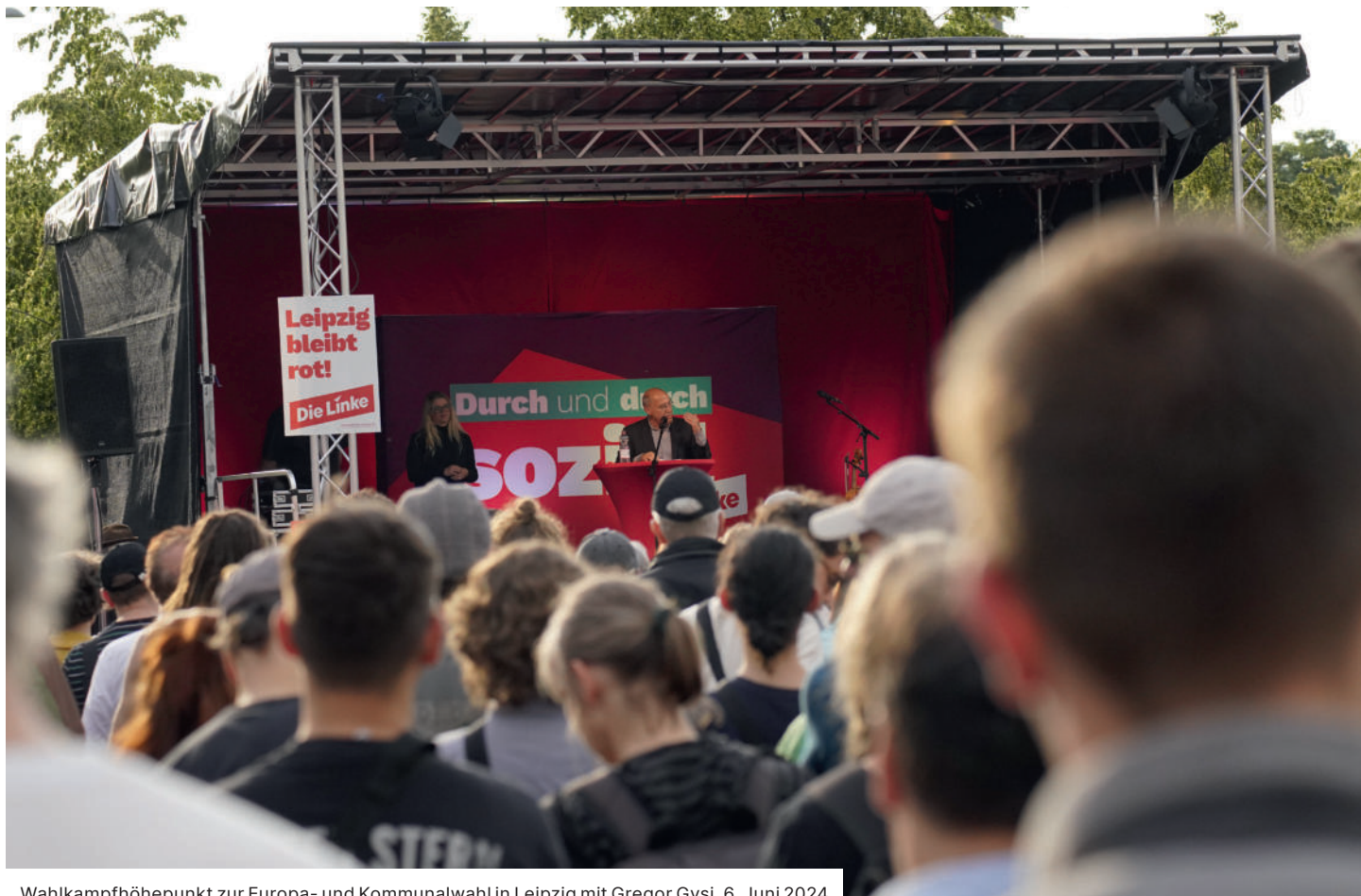
Wahlkampfhöhepunkt zur Europa- und Kommunalwahl in Leipzig mit Gregor Gysi, 6. Juni 2024